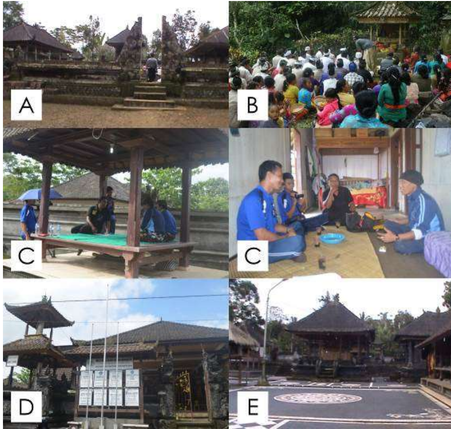
Gambar 2. Situasi lapangan dari penjelasan sub a sampai e (kiri ke kanan).