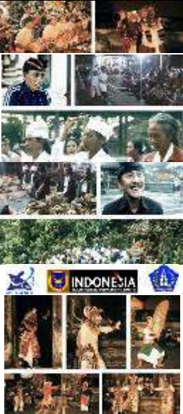
Tabel 1. Elemen visual sampul kemasan dan keping DVD. [Sumber: Dokumentasi Anom Fajaraditya]

Tindakan perampungan yaitu pendukung dan pengemasan video dokumenter. Setelah video dokumenter rampung pada proses perancangan ( editing dan konversi data dalam bentuk file DVD HD), maka langkah selanjutnya adalah mempersiapkan desain mengemas keping DVD dan sampul DVD agar terlihat menarik serta eksklusif. Perancangan pada kemasan ini menggunakan unsur desain diantaranya ilustrasi, tipografi, warna bentuk yang kemudian secara keseluruhan disebut dengan unsur visual dalam ranah ilmu desain komunikasi visual. Berikut adalah tabel unsur visual dari sampul kemasan dvd dan sampul keping dvd ditampilkan pada tabel 1.