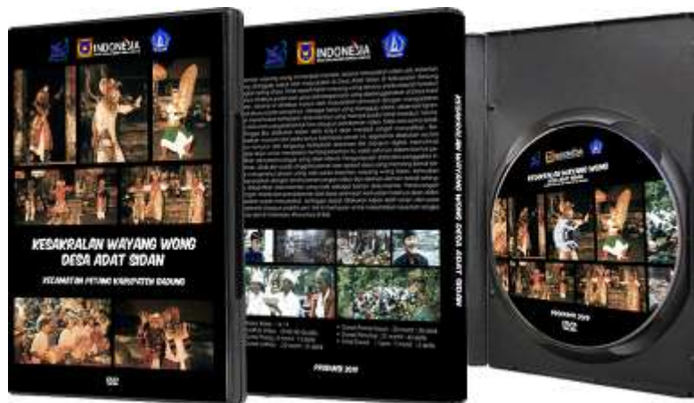
Gambar 4. Visualisasi desain final pada media.

Adapun hasil final perancangan berupa visualisasi sampul kemasan video dokumenter ini dapat dilihat pada gambar 4.