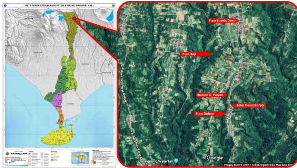
Gambar 1. Pemetaan sebaran lokasi penggalian data.

berjarak berdekatan satu sama lain dan masih dalam lingkup wilayah Desa Adat Sidan. Sebaran lokasi tempat penggalian data dapat dilihat pada gambar 1 agar dapat menggambarkan keadaan kondisi lingkungan dan situasi lapangan yang dimaksud.