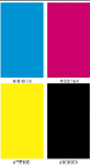
Tabel 1. Elemen visual sampul kemasan dan keping DVD. [Sumber: Dokumentasi Anom Fajaraditya]

Tindakan perampungan yaitu pendukung dan pengemasan video dokumenter. Setelah video dokumenter rampung pada proses perancangan ( editing dan konversi data dalam bentuk file DVD HD), maka langkah selanjutnya adalah mempersiapkan desain mengemas keping DVD dan sampul DVD agar terlihat menarik serta eksklusif. Perancangan pada kemasan ini menggunakan unsur desain diantaranya ilustrasi, tipografi, warna bentuk yang kemudian secara keseluruhan disebut dengan unsur visual dalam ranah ilmu desain komunikasi visual. Berikut adalah tabel unsur visual dari sampul kemasan dvd dan sampul keping dvd ditampilkan pada tabel 1.