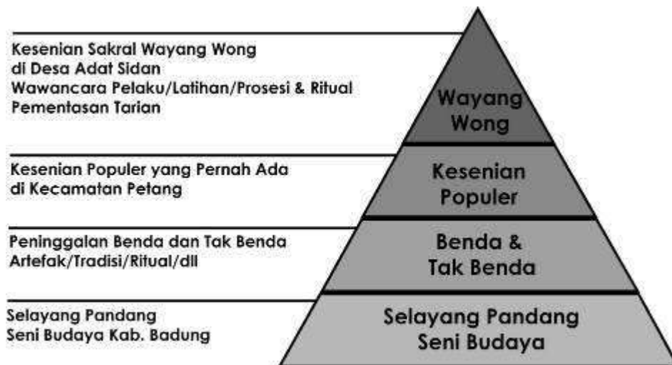
Gambar 3. Struktur pola perancangan.

secara garis besar meliputi kamera rekam video profesional, alat bantu pencahayaan, peralatan pendukung proses editing, software , hardware , dan peralatan lainnya yang mendukung pembuatan dokumenter ini.