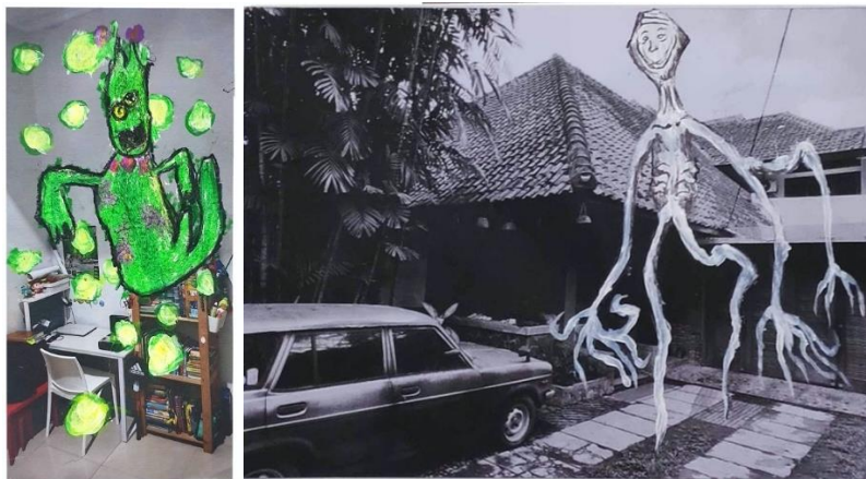
Gambar 6. Klasifikasi sampel 4

Pada klasifikasi sampel 4 ini terdapat karya dari peserta (kiri ke kanan) : JH (6 tahun) dan F (11 tahun). Pada dua karya peserta ini memiliki sedikit kesamaan pada karya-karya peserta pada Sampel 3 namun perbedaannya adalah impresi pesimisme dari situasi pandemi tahun 2020. Hadirnya figur imajinatif yang memiliki kesan menyeramkan cukup