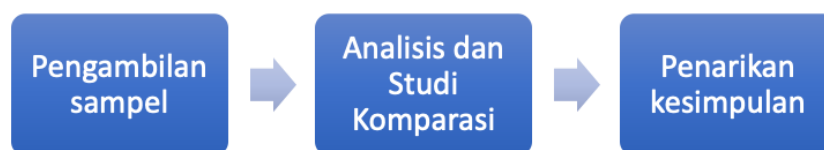
Gambar 1. Proses penelitian

Langkah penelitian secara prosedural adalah pengambilan sampel lalu melakukan analisis dengan metode studi komparasi berdasarkan metodologi visual dari Gillian Rose dan penarikan kesimpulan.