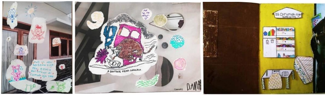
Gambar 4. Klasifikasi sampel 2

Sampel ini adalah hasil karya dari (urutan atas ke bawah): LY (8 tahun), DA (6 Tahun), QFK (10 tahun). Berbeda dengan karya-karya pada sampel 1 yang menekankan pada realita, karya-karya pada sampel 2 menekankan pada pesan-pesan yang mendukung keadaan, seperti: “pesan untuk tetap di rumah saja”, “pandemi ini cepat atau lambat akan segera berakhir”, meski begitu aspek fantasi tetap ada dengan hadirnya figur-figur imajinatif seperti peri dan banteng pahlawan. Kesamaan lain dalam karya-karya ini adalah hadirnya pesan-pesan tekstual berupa tulisan tangan untuk menyampaikan pesan-pesan kepada audiens. Pada karya DA hadir juga representasi virus SARS-cov 2, namun pada karyanya lebih relevan dengan himpunan sampel 2 ini, karena adanya penekanan pada pesan tekstual. Berikut ini adalah tabel hasil analisisnya, namun karena adanya kesamaan dan relevansi yang tinggi dalam berbagai aspek dengan sampel visual 1, maka pada hasil analisis modalitas tertentu akan mengalami kesamaan.