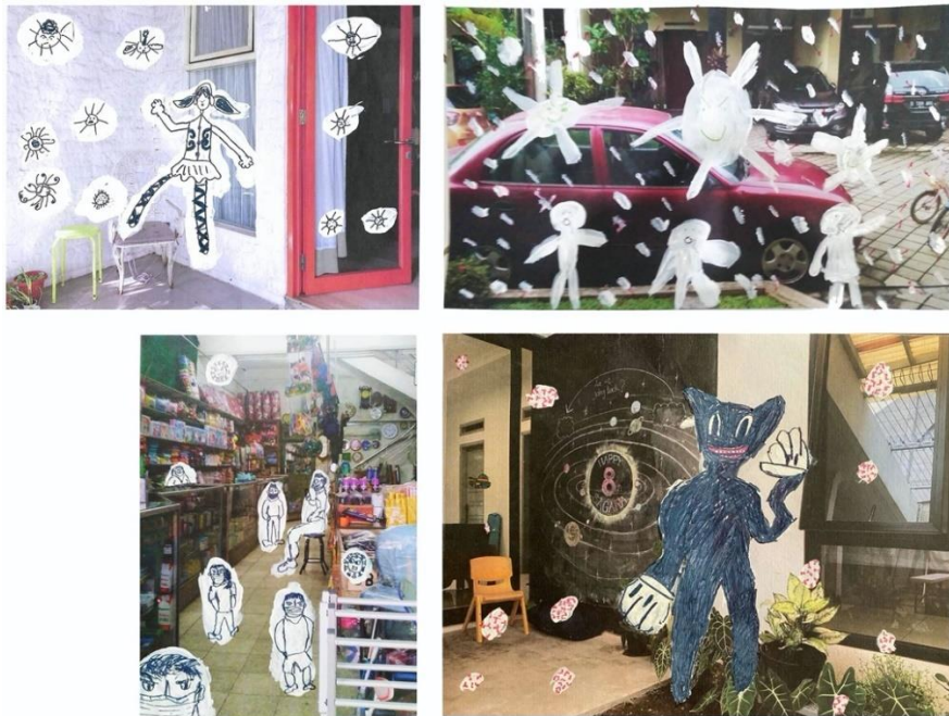
Gambar 3. Klasifikasi sampel 1

Sampel 1 ini adalah hasil karya dari (urutan kiri ke kanan, atas ke bawah): AM (8 tahun), VR (11 tahun), LO (12 tahun), dan SA (8 tahun). Kesamaan pada sampel visual ini adalah adanya representasi dari bentuk virus SARS-Cov 2 jika tidak bisa disebut sebagai fantasme . Asumsi penulis adalah adanya pengaruh media masa terhadap representasi visual virus tersebut. Meski begitu, emphasis focal point dari masing-masing karya memiliki sedikit perbedaan. Untuk karya LO dan AM, gambaran mereka lebih mengarah pada realita di lingkungan mereka, sementara untuk SA penggambarannya lebih pada fantasinya, untuk VR lebih mengarah pada penggambaran realita terkait virus SARS-Cov 2 itu sendiri, dengan tambahan figur imajinatif kreasinya. Berikut tabel analisisnya.