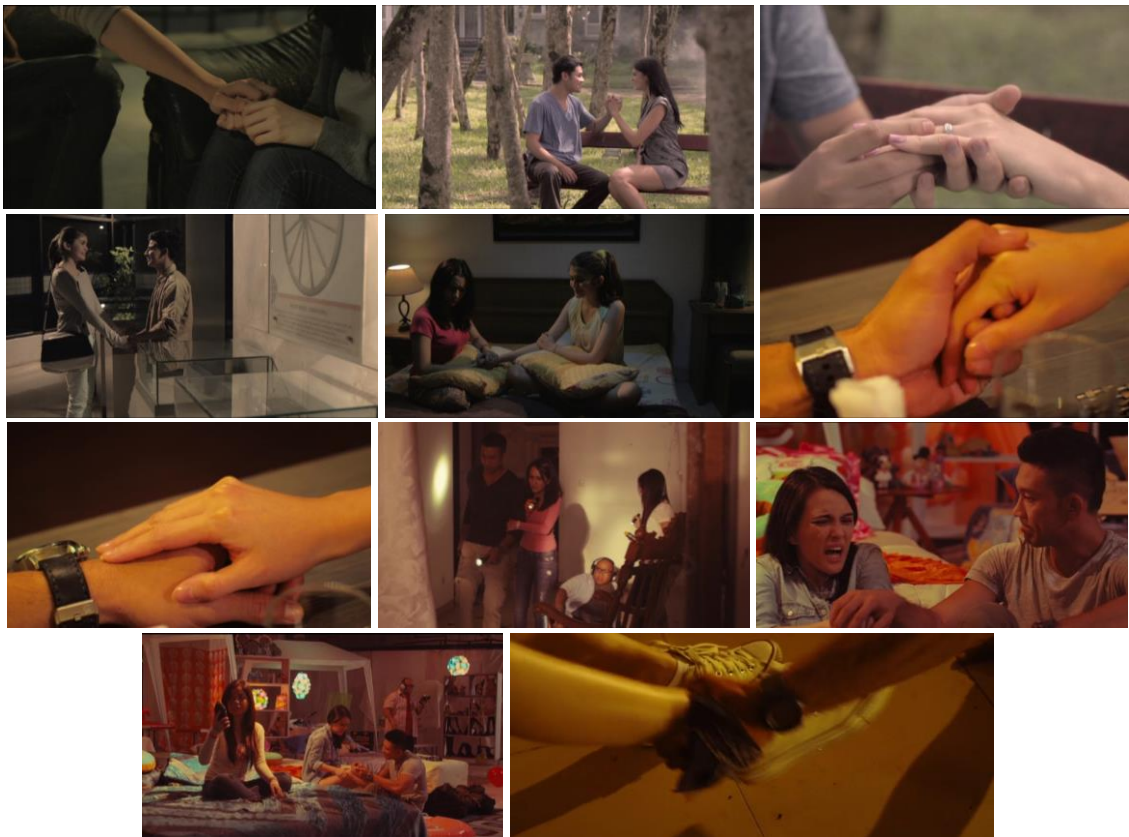
Gambar 6. Tindakan Menyentuh/Meraba

Selanjutnya, responden menemukan adegan yang dinilai terdapat unsur tindakan menyentuh/meraba di film Mall Klender dan Kamar 207. Tindakan menyentuh/meraba yang muncul berupa pegangan dan genggam tangan serta belaian atau usapan. Adegan-adegan tersebut dapat dilihat pada Gambar 6. Berdasarkan hasil wawancara yang telah dilakukan, responden tidak memandang adegan tersebut sebagai bagian dari pornografi. Adegan-adegan kontak fisik tersebut masih dalam batas yang wajar karena dipertunjukkan untuk mendapatkan suasana cerita bagi para penonton. Pegangan dan genggam tangan serta belaian atau usapan yang ditampilkan dalam adegan-adegan di film Mall Klender dan Kamar 207 memiliki kesan kehangatan, kelembutan, kepercayaan, dan kepedulian. Tidak ditemukan tindakan menyentuh/meraba yang berlebihan dan mengesankan nafsu atau birahi yang menjurus kepada persenggamaan.