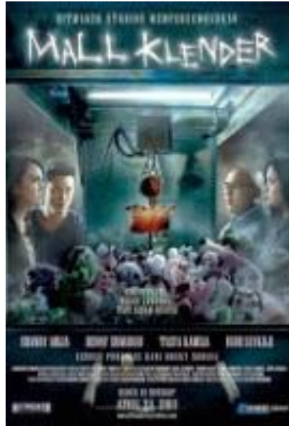
Gambar 2. Poster Mall Klender