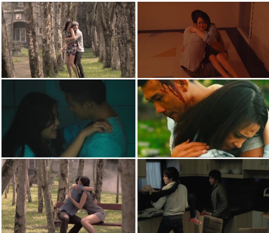
Gambar 5. Adegan Memeluk

Kemudian adegan dimana responden mendapati aktivitas berpelukan yang terindikasi mengandung konten pornografi dengan kategori softcore dapat dilihat pada Gambar 5. Berdasarkan hasil wawancara yang dilakukan dengan responden, responden tidak menilai adegan tersebut sebagai bagian dari pornografi. Adegan tersebut dipandang masih wajar sebagai bagian dari usaha untuk membawa suasana bagi penontonnya seperti suasana bahagia, haru, maupun mencekam. Adegan-adegan pelukan pun dianggap tidak melampaui batasan dan tidak memiliki kesan yang menjurus ke arah persenggamaan.