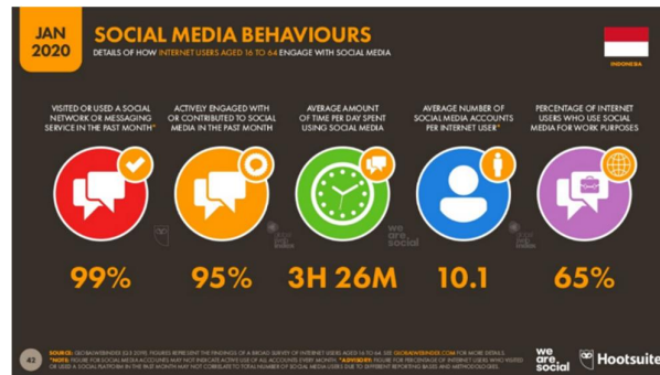
Gambar 1.1 Social Media Behaviours

melalui media sosial. Selain itu, lamanya seseorang mengakses media sosial merupakan salah satu faktor yang menjadi pemicu FoMO . Seperti yang dapat kita lihat data survei laman Hootsuite We Are Social pada gambar 1.1.