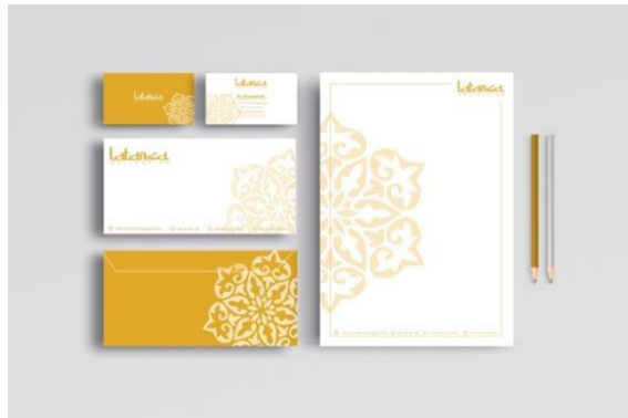
Gambar 3.2 Stationary