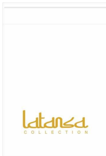
Gambar 3.7 Packaging