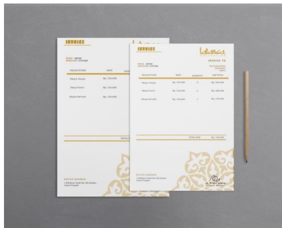
Gambar 3.3 invoice