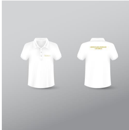
Gambar 3.11 Seragam