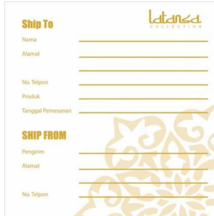
Gambar 3.8 Shippin form