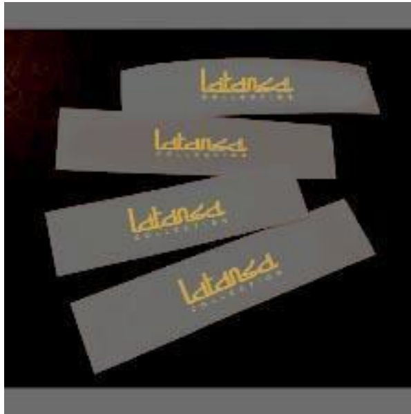
Gambar 3.4 Label