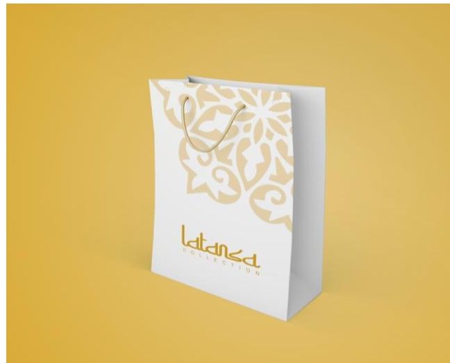
Gambar 3.6 Shopping bag