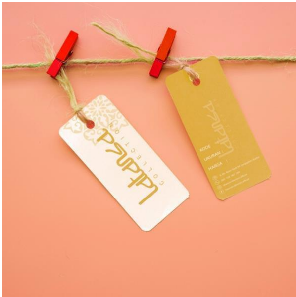
Gambar 3.5 Hang tag