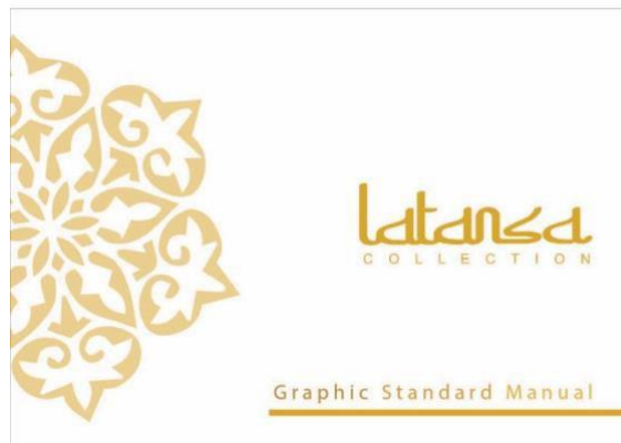
Gambar 3.1 GSM