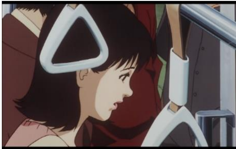
Gambar 5. Mima melamun setelah mengalami kilas balik