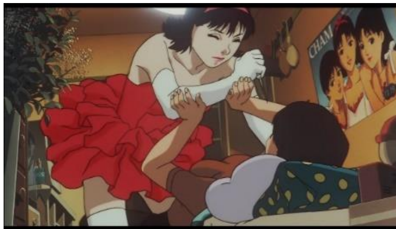
Gambar 11. Rumi mencoba membunuh Mima atas dasar kepercayaannya bahwa ia adalah Mima yang asli, dan Mima hanya ada satu