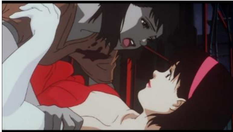
Gambar 1. Mima ingin Rumi sadar dari delusinya

みま : お願い、るみちゃんなんですよ?!目を覚まして! Mima : Onegai, Rumi-chan nandeshou? Me o samashite! Mima : Tolong, kamu Rumi-chan kan? Tolong bangun!