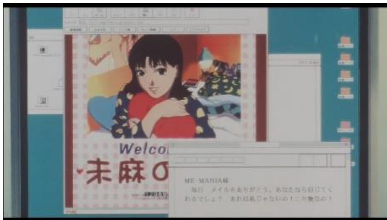
Gambar 10. Rumi berpura-pura menjadi Mima untuk berkomunikasi dengan Me-Mania

Data (14) menggambarkan Rumi yang berpura-pura menjadi Mima di situs web Mima no Heya dan berkomunikasi dengan Me-Mania melalui e-mail. Perilaku ini mencerminkan perubahan signifikan dalam perasaan Rumi tentang identitas dirinya yang sejalan dengan konsep perubahan identitas seperti yang dijelaskan dalam DSM-5.