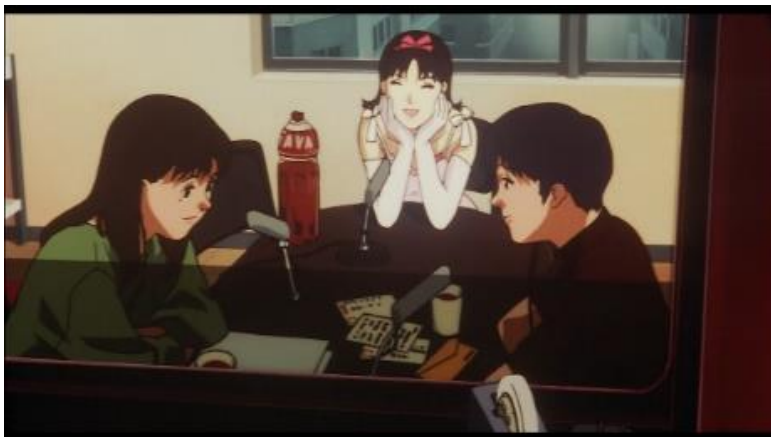
Gambar 7. Penampakan idol Mima