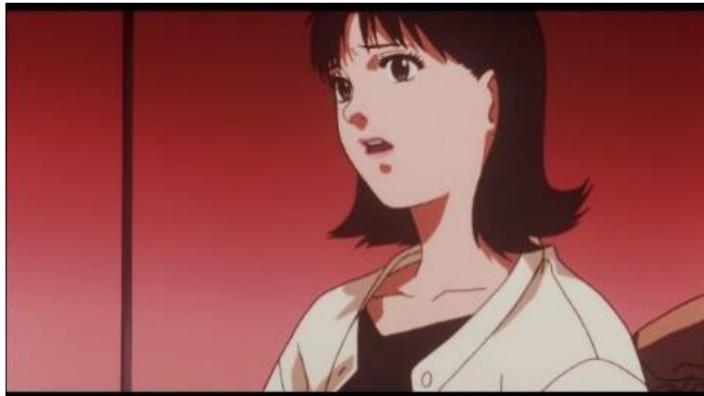
Gambar 8. Mima kaget melihat penampakan idol Mima