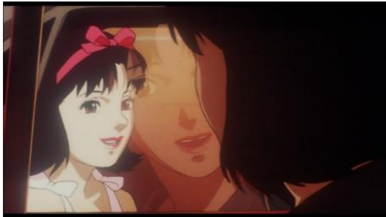
Gambar 6. Mima melihat diri Idolnya di mobil yang bergerak

Data (7) menggambarkan Mima yang melihat siluet dirinya sendiri saat masih menjadi idol di mobil yang bergerak dapat diartikan sebagai representasi simbolis dari konflik batinnya, keraguan diri, dan pengalaman derealisasi, yang sejalan dengan kriteria diagnostik gangguan derealisasi di DSM-5. Dalam adegan ini, persepsi Mima terhadap diri idolnya yang berbicara kepadanya dapat dipahami sebagai manifestasi dari pergulatan batinnya. Ungkapan yang diucapkan oleh diri idol Mima dapat diinterpretasikan sebagai ekspresi dari penilaian diri yang terinternalisasi atau representasi dari penyesalan di alam bawah sadarnya. Hal ini mencerminkan perasaannya yang bertentangan dengan pilihan kariernya, tantangan yang dia hadapi, dan disonansi antara realitasnya saat ini dan masa lalunya sebagai seorang idol. Melalui refleksi di dalam mobil yang bergerak, adegan ini menggambarkan metafora visual untuk sifat citra diri dan lingkungan sekitarnya yang terdistorsi dan berubah-ubah dengan cepat, yang merupakan ciri dari pengalaman derealisasi.