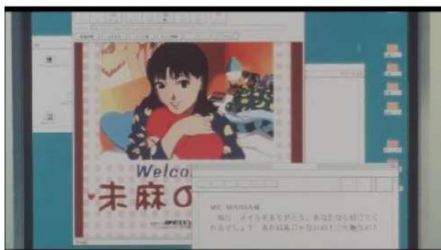
Gambar 10. Rumi berpura-pura menjadi Mima untuk berkomunikasi dengan Me-Mania [Sumber: Anime Perfect Blue ]

Data (14) menggambarkan Rumi yang berpura-pura menjadi Mima di situs web Mima no Heya dan berkomunikasi dengan Me-Mania melalui e-mail. Perilaku ini mencerminkan perubahan signifikan dalam perasaan Rumi tentang identitas dirinya yang sejalan dengan konsep perubahan identitas seperti yang dijelaskan dalam DSM-5.