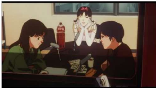
Gambar 7. Penampakan idol Mima [Sumber: Anime Perfect Blue]