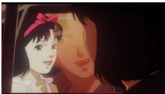
Gambar 6. Mima melihat diri Idolnya di mobil yang bergerak

Data (7) menggambarkan Mima yang melihat siluet dirinya sendiri saat masih menjadi idol di mobil yang bergerak dapat diartikan sebagai representasi simbolis dari konflik batinnya, keraguan diri, dan pengalaman derealisasi, yang sejalan dengan kriteria diagnostik gangguan derealisasi di DSM-5. Dalam adegan ini, persepsi Mima terhadap diri idolnya yang berbicara kepadanya dapat dipahami sebagai manifestasi dari pergulatan batinnya. Ungkapan yang diucapkan oleh diri idol Mima dapat diinterpretasikan sebagai ekspresi dari penilaian diri yang terinternalisasi atau representasi dari penyesalan di alam bawah sadarnya. Hal ini mencerminkan perasaannya yang bertentangan dengan pilihan kariernya, tantangan yang dia hadapi, dan disonansi antara realitasnya saat ini dan masa lalunya sebagai seorang idol. Melalui refleksi di dalam mobil yang bergerak, adegan ini menggambarkan metafora visual untuk sifat citra diri dan lingkungan sekitarnya yang terdistorsi dan berubah-ubah dengan cepat, yang merupakan ciri dari pengalaman derealisasi.