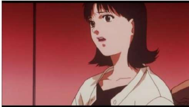
Gambar 8. Mima kaget melihat penampakan idol Mima