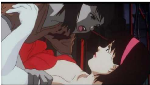
Gambar 1. Mima ingin Rumi sadar dari delusinya

みま : お願い、るみちゃんなんでしょ?! 目を覚まして! Mima : Onegai, Rumi-chan nandeshou? Me o samashite! Mima : Tolong, kamu Rumi-chan kan? Tolong bangun!