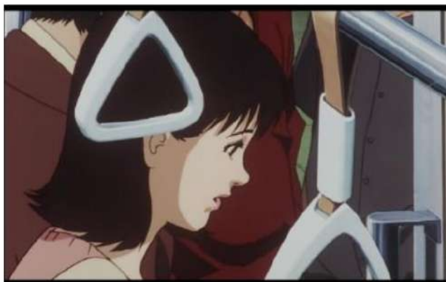
Gambar 5. Mima melamun setelah mengalami kilas balik [Sumber: Anime Perfect Blue ]