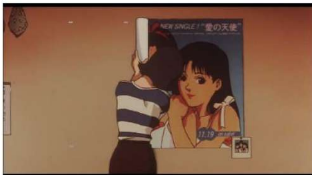
Gambar 9. Mima melepas poster CHAM! dari dinding